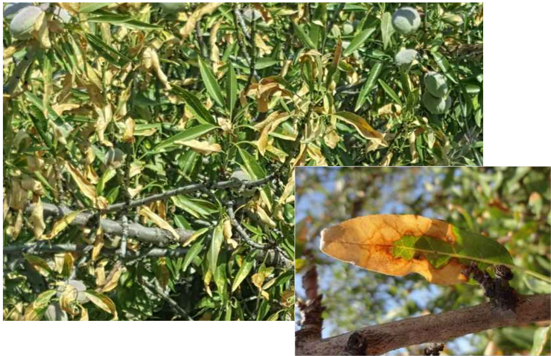
Συμπτώματα προσβολής αμυγδαλιάς από Xylella fastidiosa .