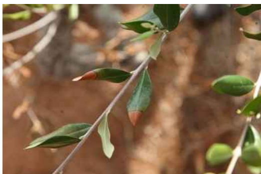
Εικόνα 1: Συμπτώματα του Xylella fastidiosa σε ελιά.

Η ασθένεια αρχικώς επιβεβαιώθηκε στην Ιταλία σε αρκετά φυτικά είδη μεταξύ των οποίων η ελιά, η αμυγδαλιά, η πικροδάφνη και η βελανιδιά με συμπτώματα ξηράνσεων στα φύλλα και ταχύτατης αποπληξίας κατά τις θερμές περιόδους του έτους. Αυτή ήταν η πρώτη αναφορά επιβεβαιωμένης παρουσίας του Xylella fastidiosa στην επικράτεια της Ευρωπαϊκής Ένωσης, καθώς και η πρώτη φορά που διαπιστώνεται η ασθένεια σε ελιές («Σύνδρομο ταχείας παρακμής της ελιάς»). Εξαιτίας της σοβαρότητας του αναφερόμενου παθογόνου και