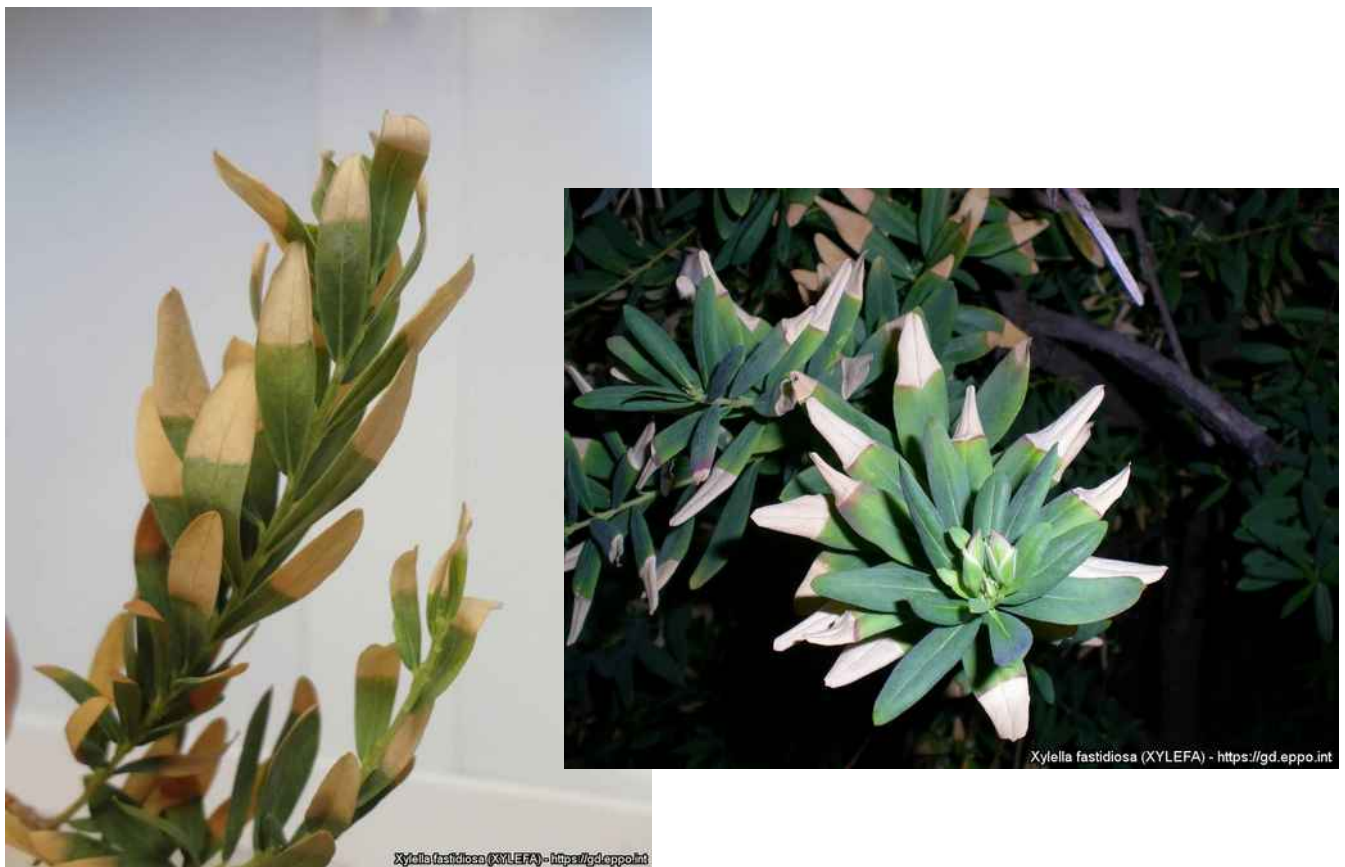
Συμπτώματα προσβολής από Xylella fastidiosa σε πολύγαλα (καλλωπιστικό φυτό) (EPPO).