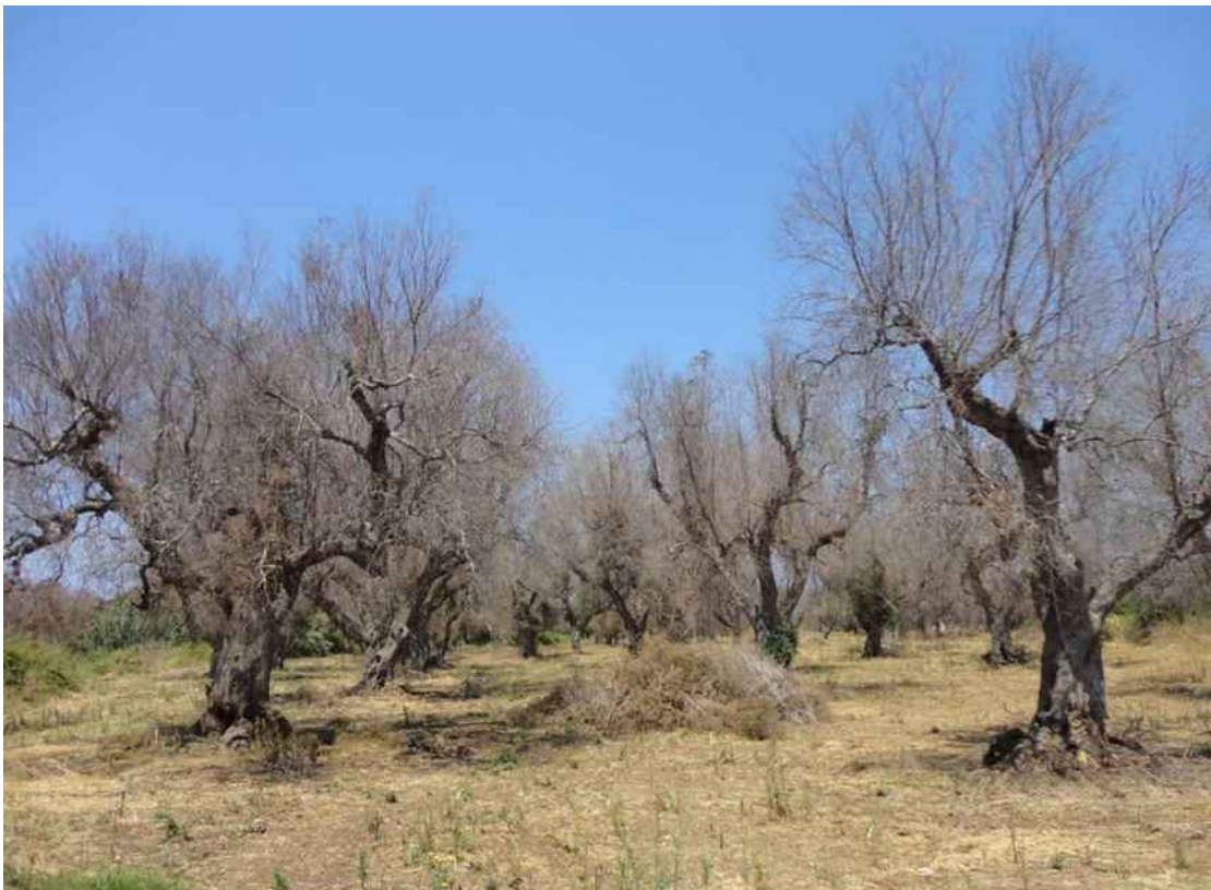
Προσβεβλημένα ελαιόδενδρα από Xylella fastidiosa στην Απουλία.