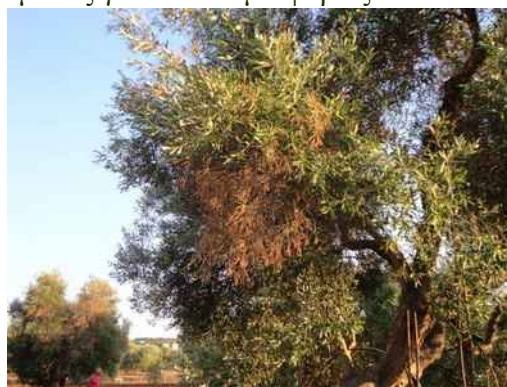
Εικόνα 2: Συμπτώματα του Xylella fastidiosa σε ελιά. Η συμπτωματολογική αυτή εικόνα μπορεί να οφείλεται σε φλοιοφάγα έντομα (φλοιοτρίβης, Euzophera bigella κ.α.), μύκητες ( Verticillium dahliae , Phoma incompta , Pseudocercospora cladosporioides ) ή και τροφopenίες (καλίου ή βορίου) και γι' αυτό απαιτείται προσοχή.

Το Xylella fastidiosa μολύνει μεγάλο αριθμό ειδών φυτών που μπορεί να μην εμφανίζουν συμπτώματα και να λειτουργούν έτσι ως πηγές μολύσματος για τα έντομα φορείς του.