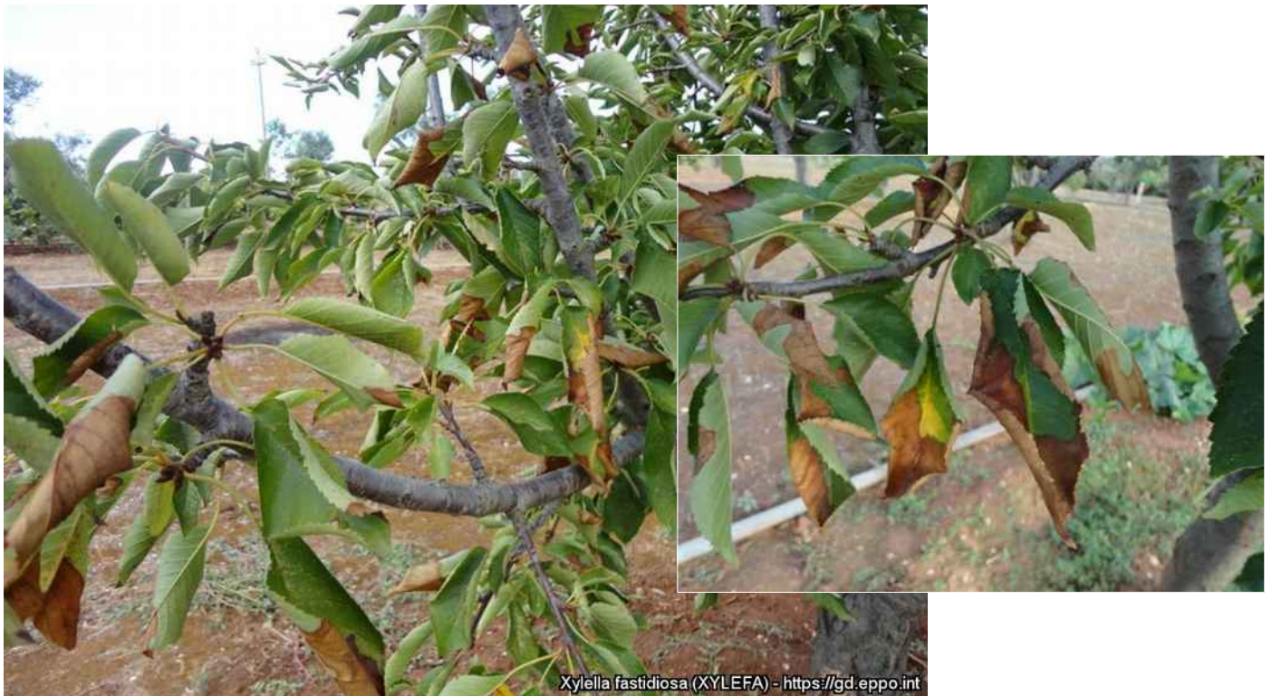
Συμπτώματα προσβολής κερασιάς από Xylella fastidiosa (EPPO).