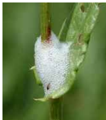
Προσβολή από προνύμφη