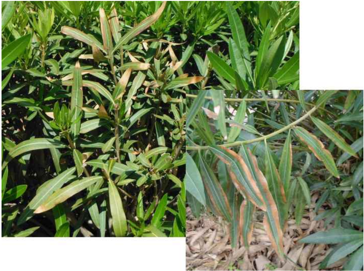
Συμπτώματα προσβολής πικροδάφνης από Xylella fastidiosa .